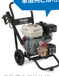
業務用高圧洗浄機